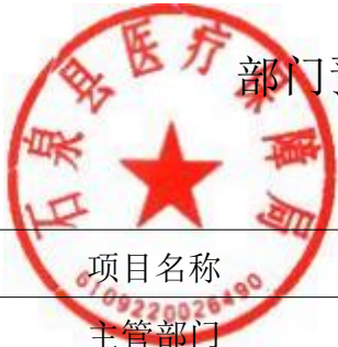
部门预算专项业务经费绩效目标表