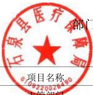
部门预算专项业务经费绩效目标表