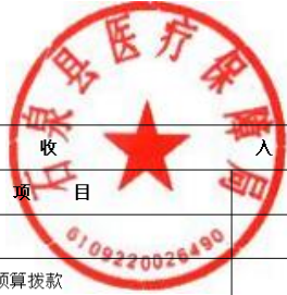
部门综合预算财政拨款收支总表